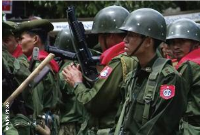
Lance-grenades utilisés par les forces de sécurité du Myanmar pendant des manifestations à Yangon, 28 septembre 2007

Pour protéger efficacement les droits humains, le traité sur le commerce des armes doit couvrir les armes militaires, de sécurité et de police et tous les équipements liés. Il ne doit pas se limiter aux huit catégories proposées par certains États – les sept catégories de véhicules, matériel d'artillerie et missiles figurant dans le Registre des armes classiques des Nations unies, ainsi que les armes légères et de petit calibre. En effet, les véhicules utilitaires et de transport militaires, qui ne figurent pas dans ce registre, sont largement utilisés dans des opérations militaires et de sécurité intérieure. Pendant la répression des manifestations, les forces de sécurité du Myanmar ont utilisé des camions militaires de fabrication chinoise bien reconnaissables, livrés par centaines au Myanmar