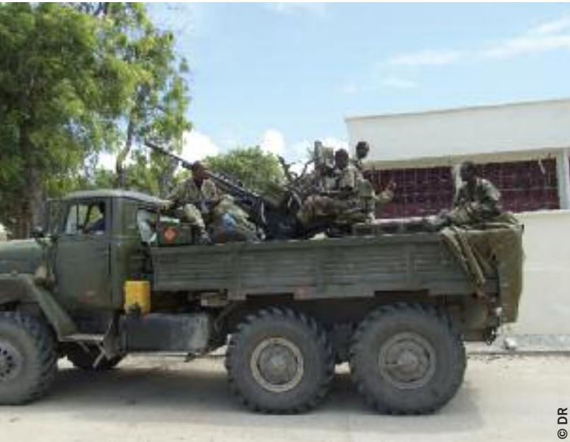
Soldats éthiopiens sur l'un de leurs véhicules militaires à Mogadiscio, mai 2007

« Le 16 octobre 2007, j'étais en Somalie. Un soir, quatre jours après mon arrivée, les Éthiopiens sont venus occuper le village. Ils ont arrêté 41 personnes, dont moi. Ils nous ont emmenés à la base militaire. J'ai pu voir des camions et une bonne quinzaine de véhicules tout terrain [équipés de mitrailleuses]. J'ai été interrogé par un Somalien qui travaillait avec les Éthiopiens. On nous a posé à tous la même question : "Que faites-vous ici ?" Nous avons répondu que nous habitons là.