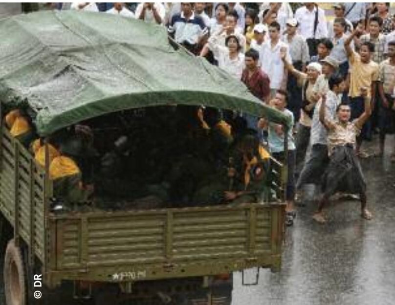
Arrivée des forces de sécurité sur les lieux d'une manifestation dans le centre de Yangon, septembre 2007

« Les autorités ont coupé les lignes téléphoniques vers cinq heures de l'après-midi. Plus tard, à 21h10, les soldats ont enfoncé la grille principale du monastère avec leurs camions militaires. Ils ont commencé à nous frapper dès qu'ils sont entrés. Après la grille, ils ont enfoncé la porte d'entrée du monastère à coups de pieds. Dès qu'ils ont pénétré dans le bâtiment, ils ont commencé à nous frapper au hasard. C'était une attaque destinée à nous empêcher de résister. Ils nous ont donné l'ordre de nous placer contre le mur, et ils frappaient à coup de bâton ceux qui n'obéissaient pas »