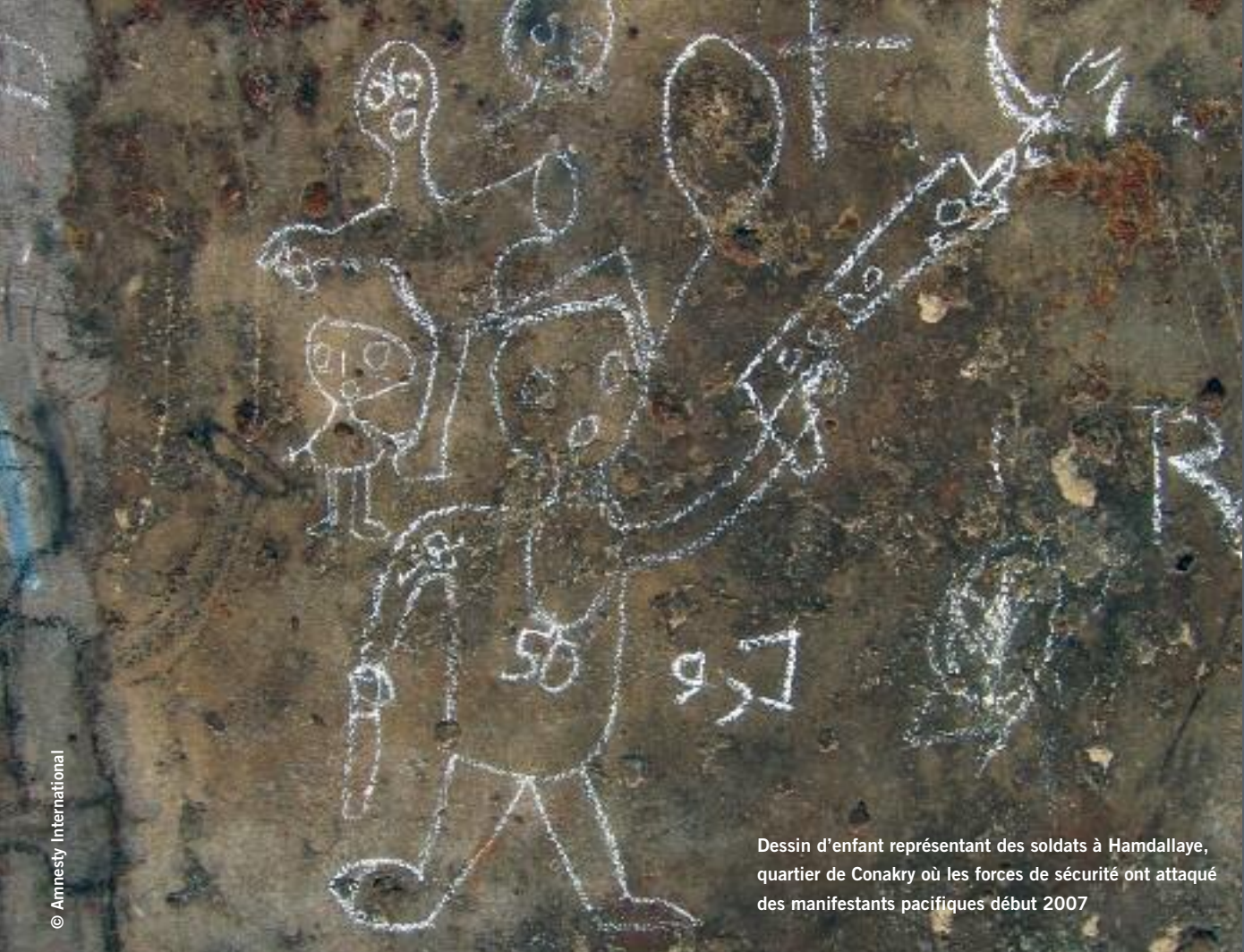
Dessin d'enfant représentant des soldats à Hamdallaye, quartier de Conakry où les forces de sécurité ont attaqué des manifestants pacifiques début 2007